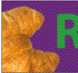
Motiv aus CMYK im Siebdruckverfahren