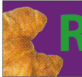
Motiv aus CMYK und Sonderfarben