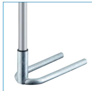
Masthalter Kompakt - Stahl